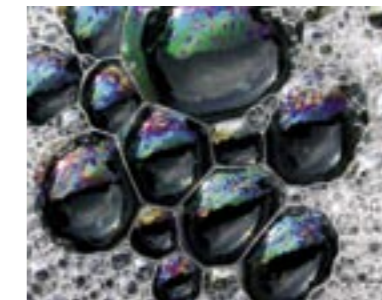
Gevelstructuur is gebaseerd op zeepbellen.